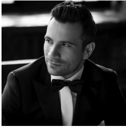
SERGEY ROMANOVSKY Russische tenor / Ténor russe